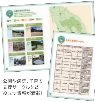
公園や病院、子育て支援サークルなど役立つ情報が満載！

ママにはもちろん、パパやおじいちゃんおばあちゃんにも、損する情報はひとつもありません。 子どもたちは情報通のパパが大好き！ 晴れた日に子どもと出かけた公園や、地域ごとに定期開催される子育て支援グループの情報など、この冊子には、長泉町の通な情報がいっぱい！ ほかには、急に具合が悪くなった時の病院や病児保育情報、休日にも開所している子育て支援センターの情報や、お仕事に復帰されるパパママには保育園情報、学童期には放課後児童クラブの情報などを掲載しています。 赤ちゃんから学童期までの幅広い年齢のお子さんに合わせて、さまざまな情報が本当に盛り込まれています。