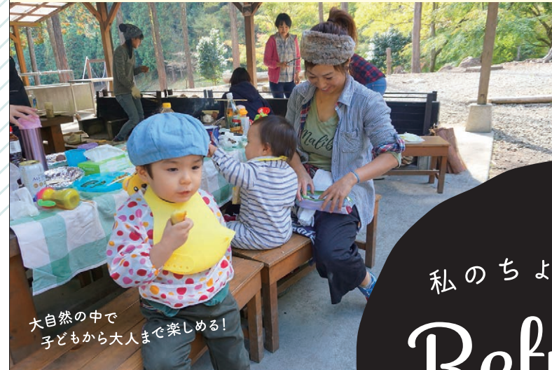
大自然の中で子どもから大人まで楽しめる！