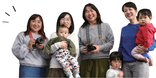
ママラッチライター きよん ママラッチライター sumi Welcome! 編集長 aozora ママラッチライター Hitsujidori

子育ては一人ではできません。 たくさんの方に助けをもらったり、迷惑をかけたりしていいのが子育てです。それは、昔から脈々と当然のこととして受け継がれてきたこと。 まずは「こんにちは」の挨拶から始めませんか？この冊子は、そのつながりづくりのためにきつと役立ちます。