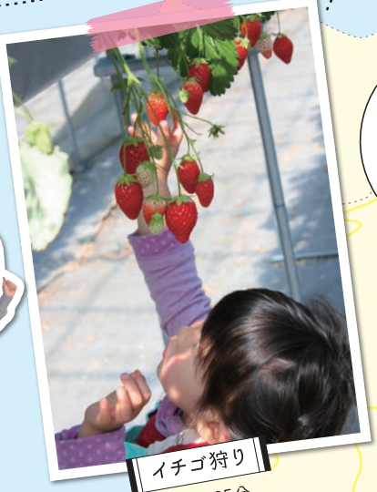
イチゴ狩り 車で約25分