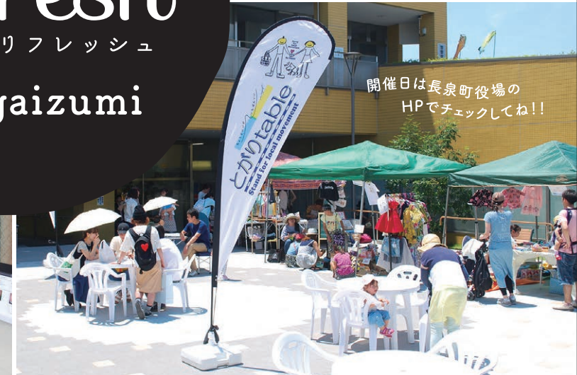
開催日は長泉町役場のHPでチェックしてね！！