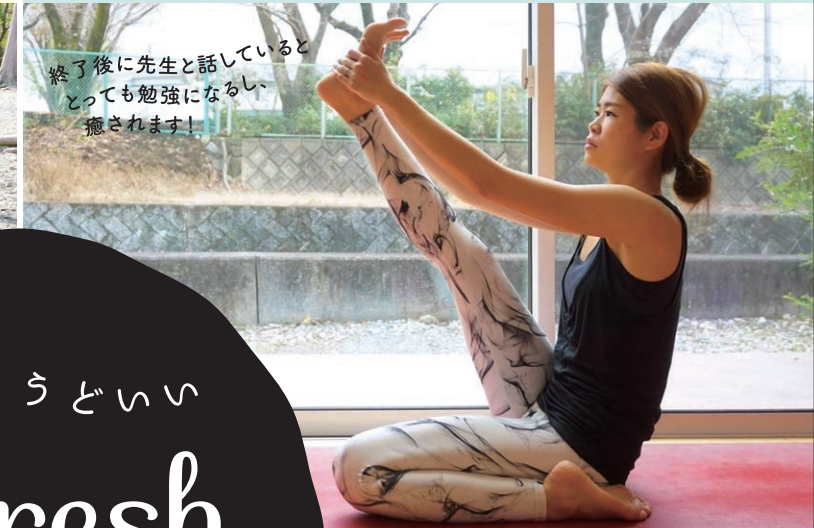
終了後に先生と話しているととても勉強になるし癒されます！