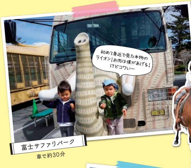
富士サファリパーク 車で約30分