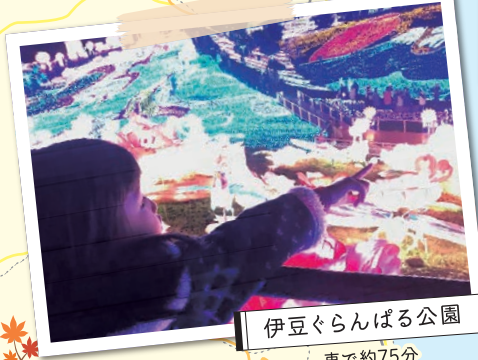
伊豆ぐらんぱる公園 車で約75分